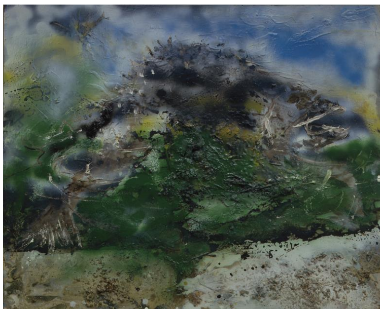
Paul Rebeyrolle, La grande truite , 2001 - technique mixte sur bois - 80,5 x 100 cm Collection musée de l'Abbaye / Œuvre acquise avec le soutien du Fonds Régional d'Acquisition des Musées, 2011

Valérie Pugin, directrice du musée de l'Abbaye