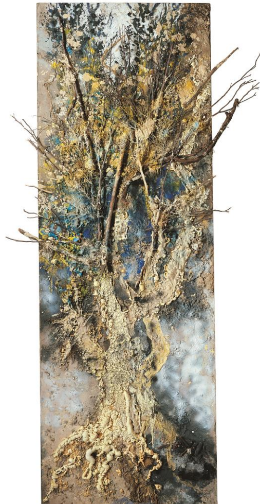
Le grand arbre , 2000 Peinture sur toile, 370 x 200 cm

Peindre un ciel et un sol avec de la peinture et du sable. Et créer un arbre naturaliste. Coller des écorces, de la mousse, du lichen, des feuilles et des branches qui dépassent ... (Les éléments naturels seront collectés au préalable par les participants.)